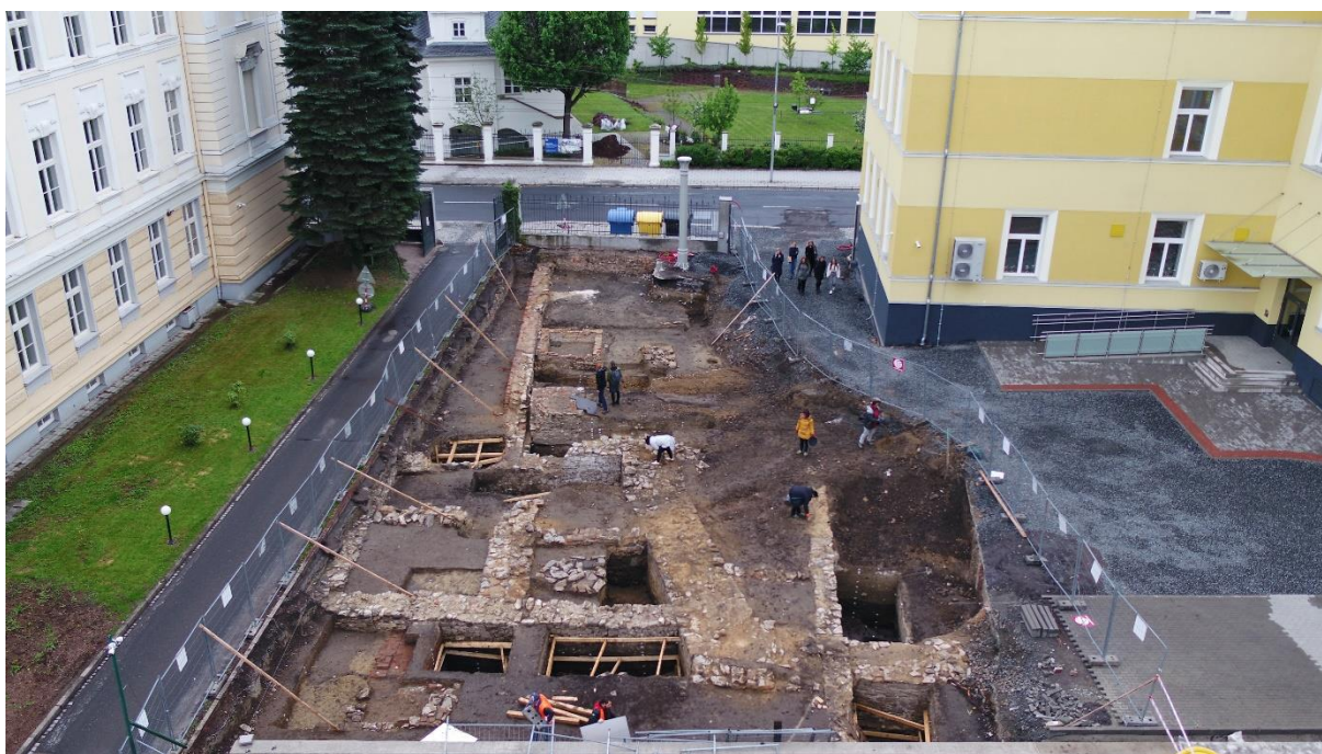
Záběr výzkumu v areálu školního hřiště na ulici Praskova z dronu.