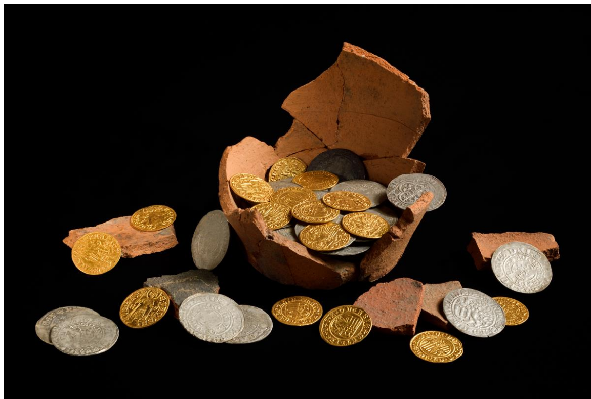
Soubor zlatých a stříbrných mincí po konzervaci, nález v originální torzálně dochované keramické nádobě. Zdroj: Národní památkový ústav (Foto Roman Polášek, 2024).

Mgr. Petra Batková, pracovnice vztahů k veřejnosti NPÚ, ÚOP v Ostravě, batkova.petra@npu.cz , +420 724 474 537, fb Národní památkový ústav Ostrava, www.npu.cz/cs/uop-ostrava