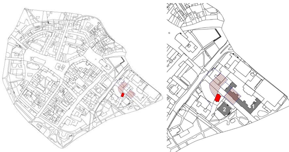
Ve výřezu současné katastrální mapy Opavy je červeně vyznačen objekt tzv. Müllerova domu čp. 1, červeným šrafováním areál někdejšího hradu a předhradí. Současná budova Mendelova gymnázia (bývalý Učitelství) je identifikována číslem 1, historická budova Slezského zemského muzea (dříve Uměleckoprůmyslové muzeum) číslem 2.