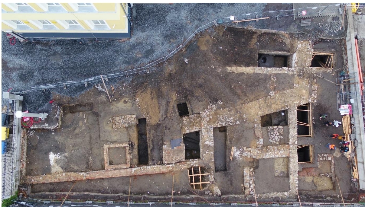
Záběr výzkumu v areálu školního hřiště na ulici Praskova z dronu. Zdroj: Národní památkový ústav (Foto Jindřich Hlas, 2024).