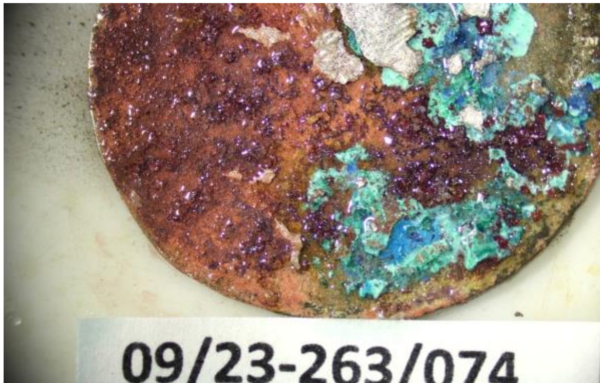
Detail nalezené stříbrné mince před konzervací.