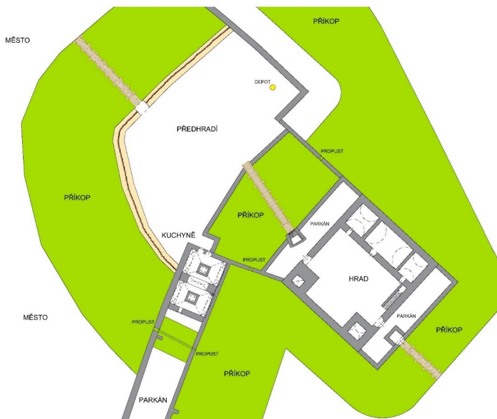
Opava, areál někdejšího hradu a předhradí, rekonstrukce středověkých zděných konstrukcí hradu a Müllerova domu v úrovni 1. NP (tmavě šedě) a předpokládaný průběh příkopů v první polovině 15. století.