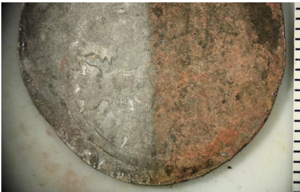
Průběh konzervace nalezené stříbrné mince.