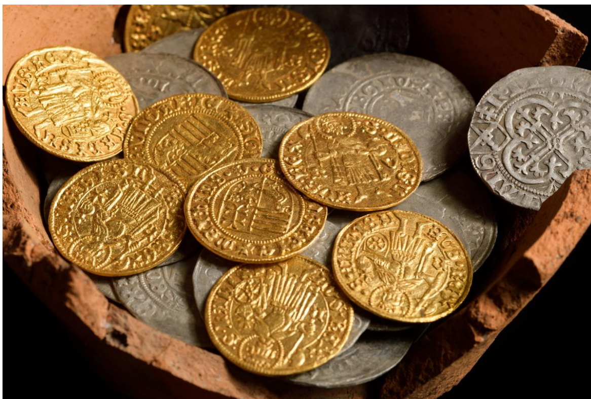
Nalezený soubor zlatých a stříbrných mincí.